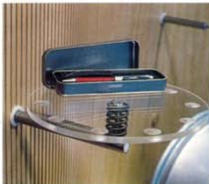
Studio Arch-O, Alfa Romeo, Roma.